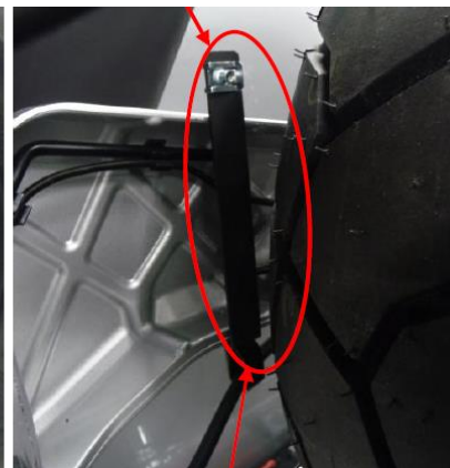
Halter und Gewindeklemme