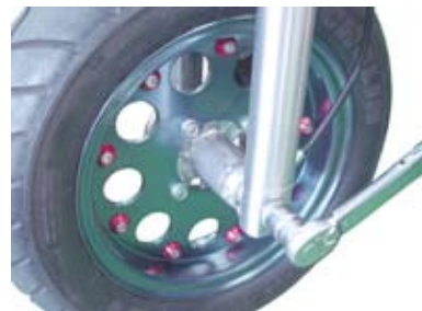
エアバルブは車両左側 (乗車時方向)

○φ 30 フロントフォークキットを取り付けの方は、次にφ 30 フロント フォーク (タイプ 1) & フェンダー取り付けステーセットの取扱説明書を 参照し、作業を行って下さい。