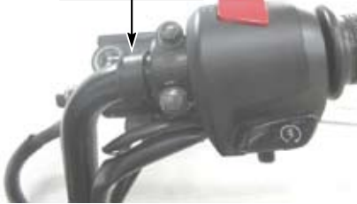
⑥ステースペーサー