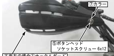
正面左の場合①ナックルガード 正面右の場合②ナックルガード