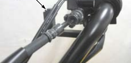
③ナックルガードステー

▲注意：①、②ナックルガードを取り付ける際、左右のガード形状をお確かめ下さい。左右で形状が異なり、左右を間違えて取り付けると破損します。ガードの形状は製品構成にてご確認下さい。