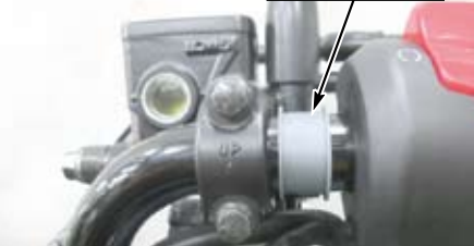
⑥ステースペーサー

▲注意：①、②ナックルガードを取り付ける際、左右のガード形状をお確かめ下さい。左右で形状が異なり、左右を間違えて取り付けると破損します。ガードの形状は製品構成にてご確認下さい。