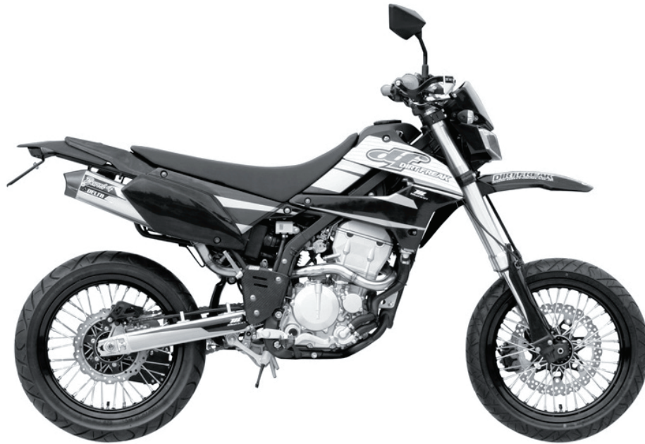
デルタバレル4-Sサイレンサー '08D-TRACKER-X