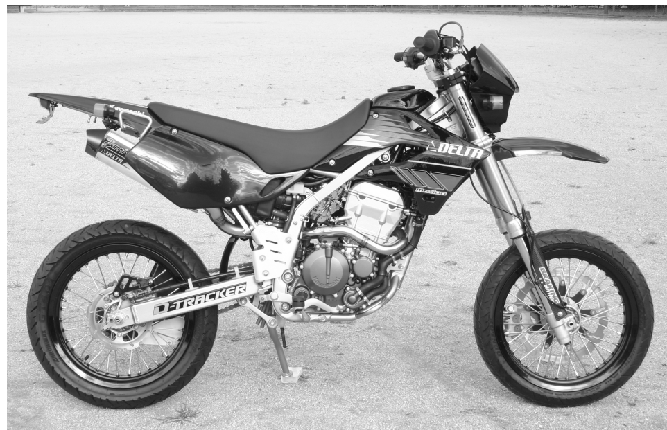
デルタバレル4サイレンサー '04 D-TRACKER