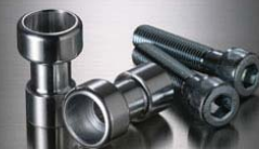
スタンドフックローラー M10