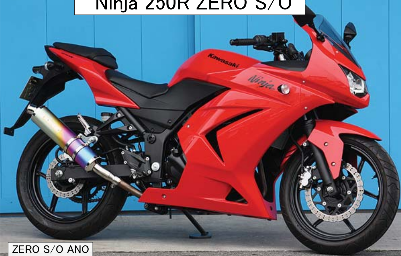
ZERO S/O ANO