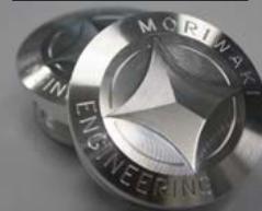
フレームホールプラグ